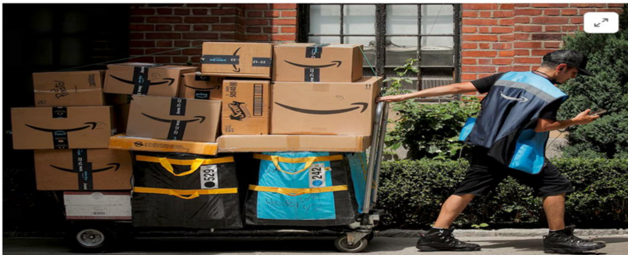
[1/2] An Amazon delivery worker pulls a delivery cart full of packages during its annual Prime Day promotion in New York City, U.S., June 21, 2021. REUTERS/Brendan McDermid/File Photo Purchase Licensing Rights

July 15, 2024 8:06 AM EDT · Updated 7 hours ago