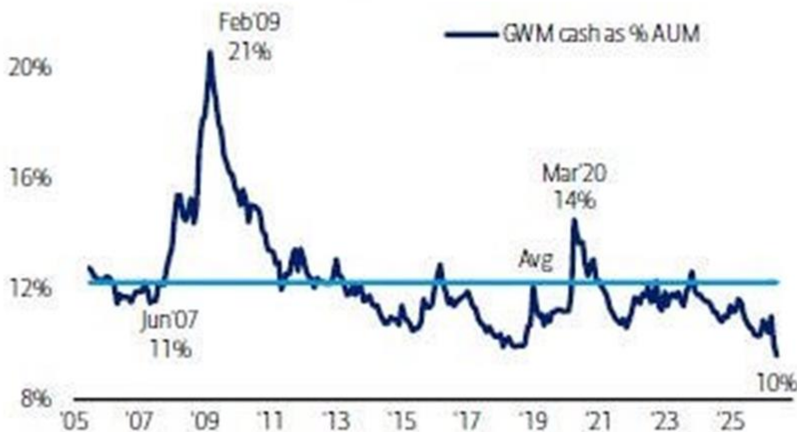
Chart 14: GWIM cash allocation at 10% BofA private client cash holdings as % of AUM

Los clientes patrimoniales de BoA en niveles de liquidez mínimos de los últimos 20 años.